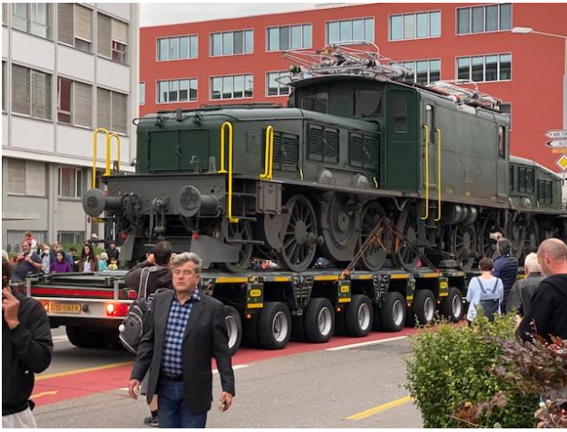
Zülig rollt der Tieflader nach 20 h rückwärts auf der Birchstrasse