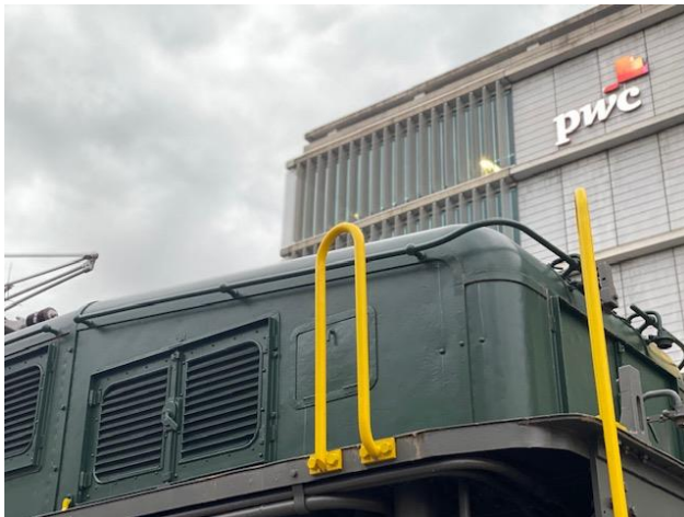
Ab ca. 1920 für 70 Jahre links Lokomotivbauhalle, jetzt PWC & Krokodil