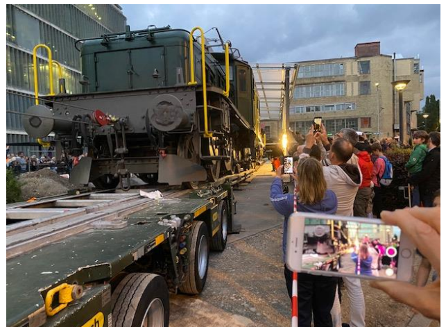
Viel Publikum bewundert und filmt das präzise Abrollen in den Käfig