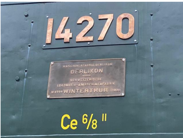
Unsere Ce 6/8 II 14270 mit den wieder befestigten Beschilderungen