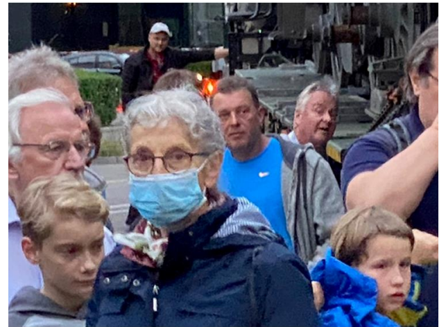
Der Anteil Corona-Masken ist vergleichbar mit dem öffentlichen Verkehr