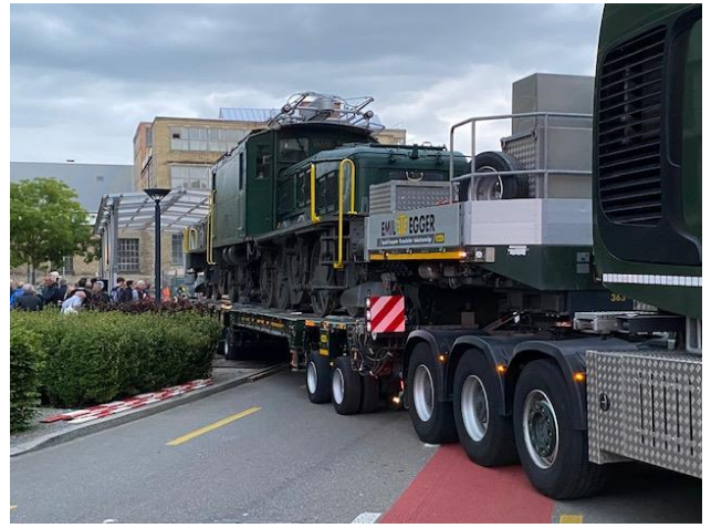
Dann wird in den PWC-Pocket Park Richtung Käfig eingebogen