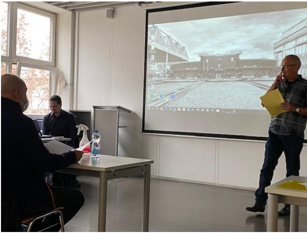
Hasi freut sich, heute gemeinsam auf die Lok-Zukunft zu blicken