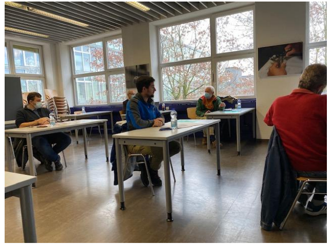
Wir wollen für die Wartung der Lokomotive voneinander lernen