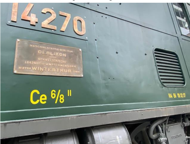
November 1966 die zweitletzte, 19.11.2017 die letzte Revision