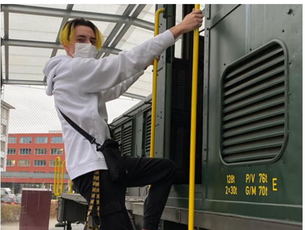
Der Polymechnik-Lernende der LIBS ist bereit, einzusteigen