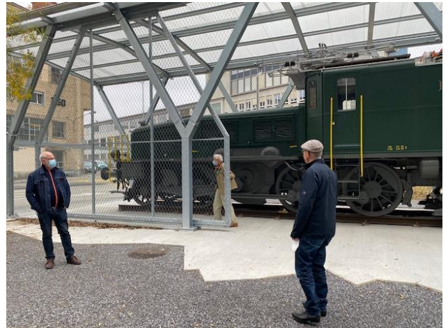
Die Objekte der Wartung werden vor Ort genauer angeschaut