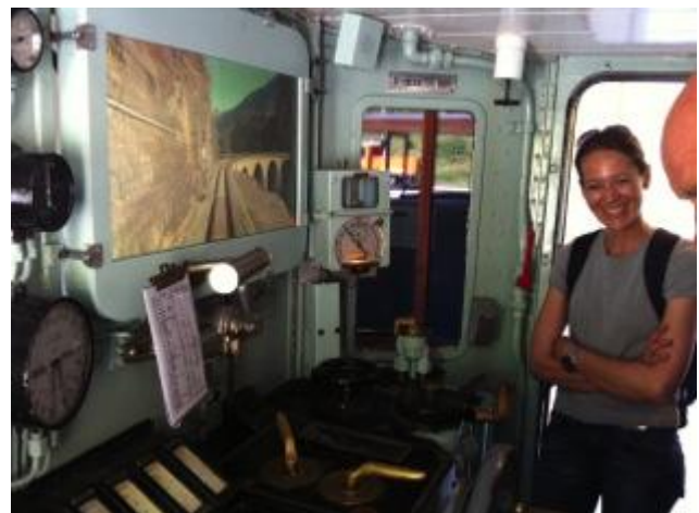
Soll man den Führerstand zeigen? (wie hier Krokodil in Bergün)