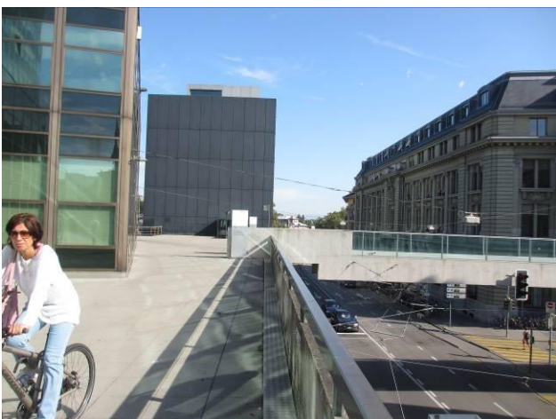
Geschäftsstelle Bollwerk 12 beim Berner Hauptbahnhof