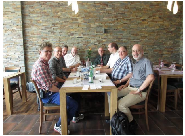
Treffen WSOe und Verein Industriegeschichten am 13.7.12