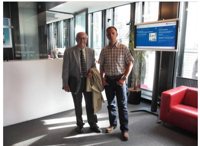
Die Sitzung hat eine erfreuliche Übereinstimmung ergeben