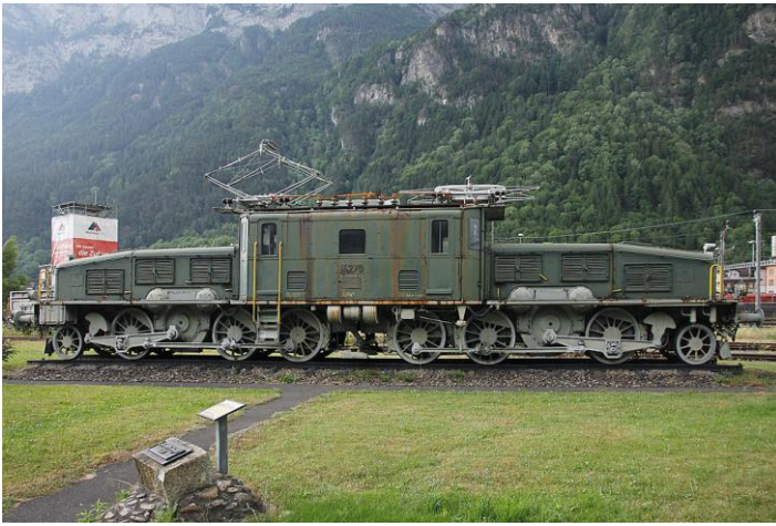
Wie kommt diese Ce6/8 II 14270 von Erstfeld nach Oerlikon?