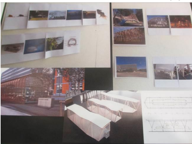
Das neue Modell (10zu8) soll den Einblick verbessern