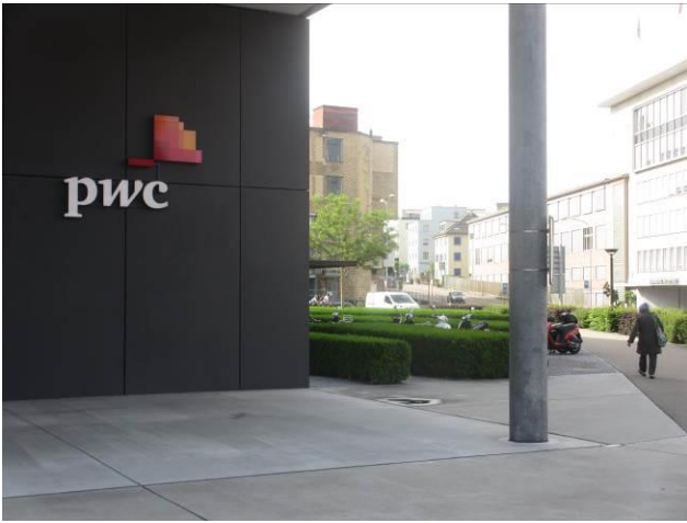
Das PwC-Gebäude auf Boden einer UBS-Tochter