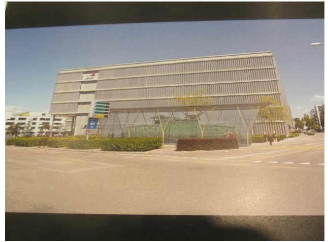
Ansicht von Kroki vor PwC-Bau über die Birchstrasse