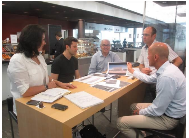
UBS und PwC bekennen sich zur Projekt-Weiterführung!