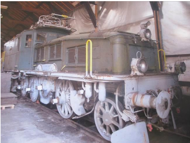
Das Rostodil blickt wieder besseren Zeiten entgegen